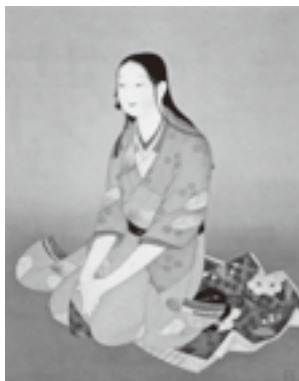
「朱唇」 1931年 (京都国立近代美術館蔵)

生誕130年を記念して開催する本展では、初期から晩年までの代表作はもちろん、新出作品、滞欧期の模写、写生帖など約75点を展覧し、菊池契月の芸術世界に迫る。