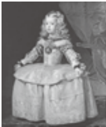
ディエゴ・ベラスケス「白衣の王女マルガリータ」 1656年頃 (ウィーン美術史美術館蔵)

1869年に日本とオーストリア・ハンガリー二重帝国が国交を樹立し140年が経つ。本展はこれを記念して、600年以上の長きにわたってヨーロッパに君臨した名門王家ハプスブルグ家ゆかりの品々を並べる。マクシミリアン1世の宮廷画家デューラー、スペイン王フェリペ4世の宮廷画家ベラスケス、ネーデルランドのアルブレヒト大公の宮廷画家ルーベンス、さらにラファエロ、ティツィアーノからゴヤまで、16世紀から18世紀にかけてのヨーロッパ芸術最盛期の名画は圧巻。また皇帝たちを魅了し、宮廷を飾った工芸や武具の数々は、意外にも同時代の日本の美術工芸と同調する点が少なくない。芸術を庇護し愛し続けた王家の栄華を物語る名品の数々を堪能できる。なお特別出品として、明治天皇からオーストリア・ハンガリー二重帝国(当時)に贈られた画帖と蒔絵棚が両国友好の歴史を辿る品として初めて里帰り展示される。