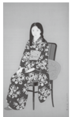
「友禪の少女」 1833年 (京都市美術館蔵)