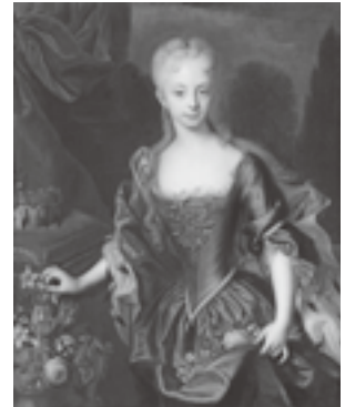
アンドレアス・メラー 「11歳の女帝マリア・テレジア」 1727年 (ウィーン美術史美術館蔵)