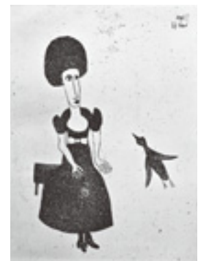
「鳥と女」 31.6×22.7cm (1973)