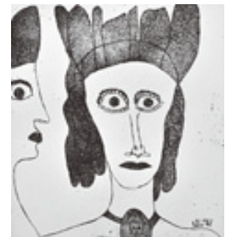
「メダイヨンの女」 33.7×31cm (1976)