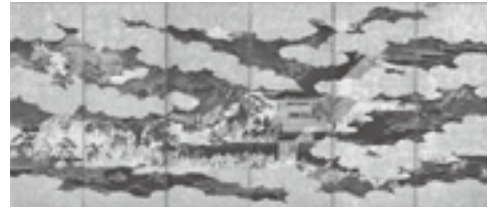
「大原御幸図屏風」江戸時代 文化庁蔵

本展覧会では、世界遺産・厳島神社に伝わる平家納経をはじめとした数々の至宝、清盛や平氏一門、同時代のゆかりの人物の肖像画や書、日宋貿易でもたらされた大陸由来の資料、主要な源平合戦の様子を描いた絵画のほか、平安末期の文化を象徴する美術品・工芸品を多数紹介します。(前期: 6/16～7/1、後期: 7/3～7/17作品展示替えあり)