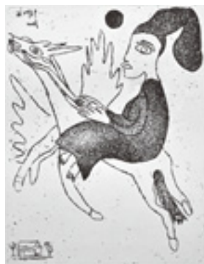
「ペガサスと女」 33.3×25.7cm (1976)