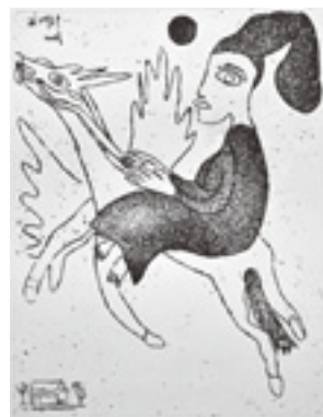
「ペガサスと女」 33.3×25.7cm (1976)