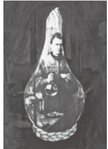
[husband and wife] 2012 162×112cm graphite, oil on canvas

2005 ART CAMP in Kunst-Bau 2005 ギャラリーヤマグチ Kunst-Bau / 大阪 2006 ART CAMP in Kunst-Bau 2006 ギャラリーヤマグチ Kunst-Bau / 大阪 PICA 京都市立芸術大学芸大ギャラリー / 京都 2007 re-concentration 2 石田大成社ホール / 京都 PICA 2 京都市立芸術大学芸大ギャラリー / 京都 CX展 CASO (Contemporary Art Space Osaka) / 大阪 2008 Identity IV nca | nichido contemporary art / 東京 ART AWARD TOKYO 08 行幸地下ギャラリー / 東京 2009 ART CAMP in Kunst-Bau 2009 ギャラリーヤマグチ Kunst-Bau / 大阪 PICA 3 ART COURT GALLERY / 大阪 京都オープンスタジオ「4つのアトリエ」 桂スタジオ / 京都 2010 Transmit Program # 1 「きょう・せい」京都市立芸術大学ギャラリー @KCUA / 京都 京都オープンスタジオ2010 桂スタジオ / 京都 2011 epiphany-世界を発見する方法 中之島デザインミュージアム de sign de > / 大阪 京都オープンスタジオ 桂 桂スタジオ / 京都