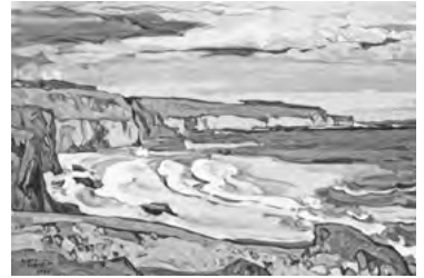
石川寅治「寄せる浪」1957年 第13回 日展 油彩50号

松島、銚子、剣崎、堂ヶ島、房総、犬吠埼、瀬戸内、伊豆大島、南紀、白浜、波切、尾道、鞆の浦、桂浜、東尋坊、熊野灘、久々子、出雲、鳥取、小豆島、神戸、天橋立、伊勢など日本各地の風景や風物、漁師たちを描いた洋画、日本画、水彩など約40点を一堂に展観します。是非ご覧下さい。