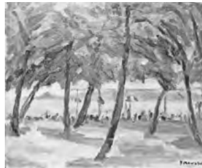
川端弥之助「天橋立」 油彩8号