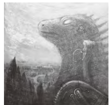
「明日を待つ」 S50号 キャンバス・アクリル