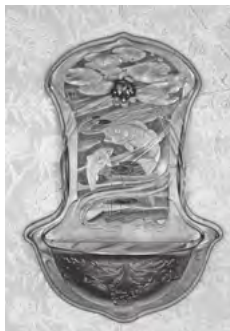
ヘルマン・ゲラートル 「壁付き水盤」 (ハンブルグ工芸博物館蔵)

19世紀末から20世紀前半に到る美術デザインの展開を、世界的な視野から通覧できる本展には、国内外約70カ所から集めた約400点の様々なジャンルの作品が展示される。また過去における型紙の影響を時代に即して改案しながら、今のデザイン活動に活用する様々な取り組みなども紹介されている。(金曜：夜間開館午後8時まで)