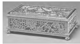
ティファニー&工房「ぶどう模様の箱」 (メトロポリタン美術館蔵)