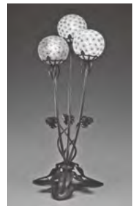
ドーム兄弟 「ランブ〈たんぼぼ〉」 (北澤美術館蔵)