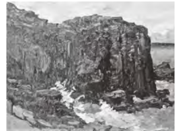
澤部清五郎「東尋坊」 1934 (昭和9) 年頃 油彩15号