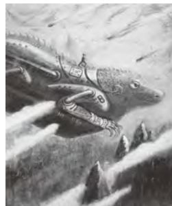
「立ち向かう／Confront」 F30号 キャンバス・アクリル