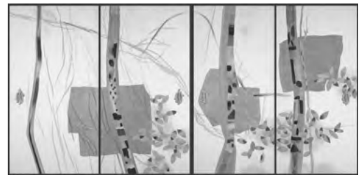
「静風自來」(法然院方丈襖絵部分) 1971年