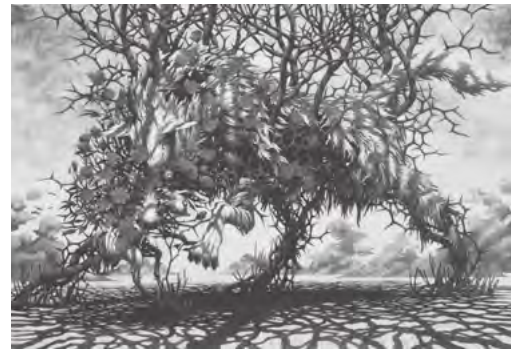
「ワタシはワタシ」 P100号 (w1620×h1120) 【素材】木製パネル・アクリルカラー・オイルパステル