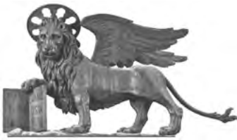
「聖マルコのライオン」 1490年頃 木、彫刻、着彩、金

本展では、豊かな色彩と雅やかな詩情を重視するヴェネツィア派の絵画をはじめ、華麗貴族の暮らしやゴンドラ、ガレー船にイメージされるヴェネツィア共和国の海上交易の様子を伝える品々約140件を一堂に展示します。世界遺産ヴェネツィアの歴史と芸術を存分に堪能ください。