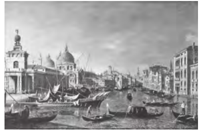
「ブンタ・デッラ・ドガーナ付近の カナル・グランデ」 1740年頃 油彩

ラゲーナ(潟)に築かれた美しい水上の都、ヴェネツィア。イタリア北東部に位置し、地中海交易の拠点として栄耀栄華を誇ったことから「アドリア海の女王」とも称されました。13世紀には強大な海軍力と交易による富を背景に黄金期を迎え、16世紀のルネサンス期には多彩な文化、芸術が開き世界中の富裕層から愛されました。その栄光の軌跡は、サン・マルコ広場やドゥカーレ宮殿など街の至る所に受け継ぎ、今も世界中の人々を魅了し続けています。