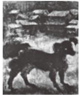
「犬」1950年 (東京国立近代美術館蔵)

の長きにわたる苦闘が始まったのである。12年に帰国後は大学などで美術史を講じる傍ら絵画制作を続けた。昭和7年東京銀座の資生堂画廊での初個展は画家としては極めて遅い41歳の時だった。その後日本独自の油彩画を生み出そうと努力を重ね、その成果を以後の独立美術協会展を中心に発表した。深みのある暗色を基調とした須田絵画は光と蔭が交錯する重厚な画面となり、画面の中で存在する事物と蔭は等価性をもつことで、画面の中での距離感の意味を失い、蔭と事物は主役を相互交換する。須田国太郎の光は、単に物体に色彩を与えるだけのものではなく、暗闇に劇的世界を語るものとなった。