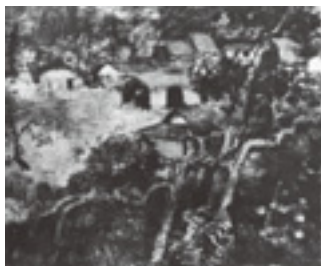
「大和般若寺近郊」1941年

明治24年(1891)京都市中京区の京町家に生まれ育った須田国太郎は、京都帝国大学で美学・美術史を専攻、大正8年絵画研究のために渡欧した。4年間スペインのマドリッドを拠点に滞在し、テンペラの下塗りの上に油彩を重ねるヴェネツィア派の色彩表現とティントレットやエル・グレコを経て色彩を混和させるバロック的明暗法の作品群に出会い、それらの相反する「前近代」の表現を自らの絵画理論の中に融合させる