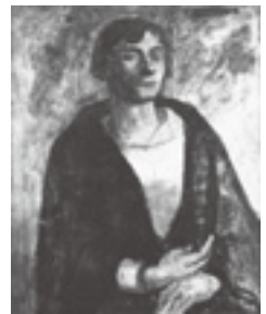
「ルイザ・バルバラ」1922年 (京都市美術館蔵)