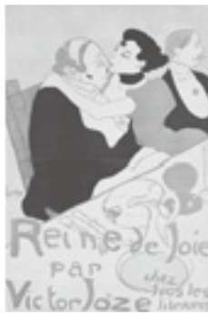
ロートレック「歓楽の女王」 1892年(京都工芸繊維大学蔵)