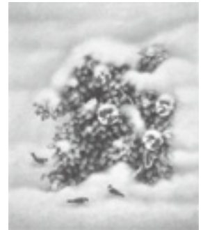
「雪つばき」1994年 第9回日展