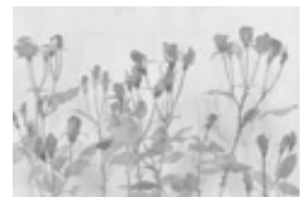
〔バラ〕(プリンセスミチコ)

「御所の花を絵がかせてもらった月日は、とても満ち足りた一時期となりました。もともと花が好きでしたが、絵に描いてみると“好き”という言い方では足りなくて“自然の花の命が身近なものとなった”という方がいいかもしれません。」 (安野光雅)