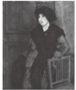
澤部清五郎「ショールの女」 1913(大正2)年