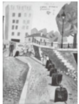
〔サン・マルタン運河の坂道〕 1952年

本展では、ヨーロッパの風景を題材にした瀟洒な素描、ペン画、油彩画の数々を中心に、現地の芸術体験を糧に制作した帰国後の作品も併せて展観する。異文化に触れて新たな表現の扉を開いた印象の心を感じ取って頂ければ幸いである。