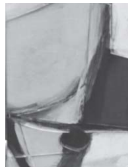
「My garden」 SM