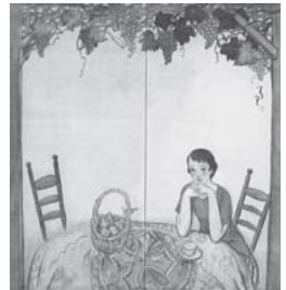
竹久夢二「憩い(女)」 昭和初期頃 (夢二郷土美術館蔵)