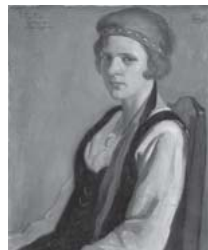
鶴田吾郎「フィンランドの娘」 1930(昭和5)年