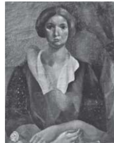
ロジェ・ビッシェール 「薔薇をもつ婦人像」 1920年頃