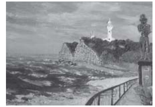
「いわき市塩屋崎燈台」2013