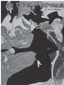
ロートレック 「ディヴァン・ジャポネ」 1892~93年 (大阪新美術館準備室寄託)

大正ロマンを代表する詩人画家・竹久夢二 (1884~1934) の生誕130年を記念し、新たな視点からその芸術と生涯を振り返る展覧会。独特の情感をたたえた美人画で一世を風靡した夢二だが、雑誌の表紙や広告から日用品まで幅広くデザインを手掛け、商業美術や出版の世界でも卓越した存在だった。その姿は、19世紀末のパリで活躍したロートレック (1864~1901) に重なる。ともに画壇に属さず、時代の先端を読み取る感性を持ち、版画やポスターを独立したジャンルにまで高めた二人は、ベル・エポック (良き時代) を象徴する芸術家といえる。本展では、夢二とロートレック、また東西のベル・エポックに共通するロマンチズムに着目し対比を試みるものだ。