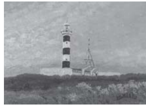
「男鹿半島入道崎燈台」2012