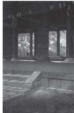
「京都知恩院」 1933（昭和8）年