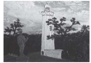
「三保の松原清水燈台」2014