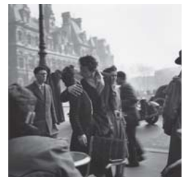
「市役所前のキス」 1950年