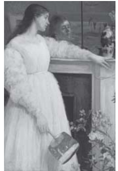
「白のシンフォニー No.2: 小さなホワイトガール」 1864年 (テート美術館蔵)