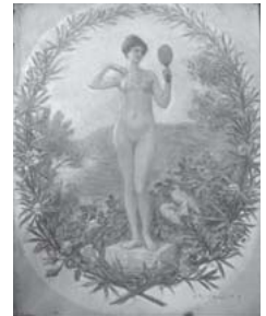
ラファエル・コラン 「アフロディテ」 挿絵原画―題名飾り― 1909年