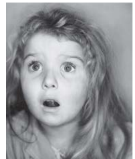
「びっくりさせられた子供」 1951年