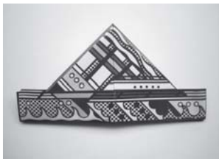
リキテンシュタイン 17×33cm