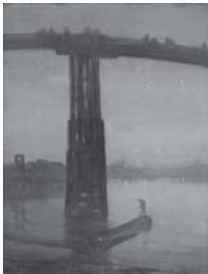
「ノクターン：青と金色オールドバタシー・ブリッジ」 1872~75年 (テート美術館蔵)

本展ではまず、パリ時代にギュスターヴ・クールベの作品と出会うことでリアリズム (写実主義) から出発したホイッスラーが、唯美主義の画家として独自のスタイルを確立していくさまを、彼が主に手がけた二つのモチーフ、人物画 (第一章) と風景画 (第二章) で紹介する。そして彼の画風展開における最も重要な契機であるジャポニズムが、どのような輝かしい成果へと結実したかを第三章で紹介。欧米各国から集められた油絵画・水彩画・版画の代表作約130点と、ホイッスラーに影響を与えた浮世絵などの参考作品・資料も含め、19世紀後半の欧米画壇を席卷した巨匠の輝きを一望できる大回顧展である。