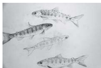
藤原裕之「アマゴの写生」