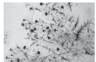
定家亜由子「あさざみ野の音」60P 2014年