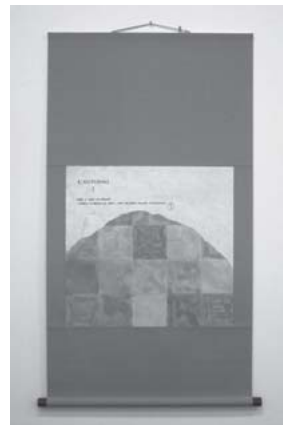
三樹正典「秋」 2012アクリル