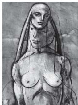
舟越桂「砂漠で見る夢」 2006 銅版