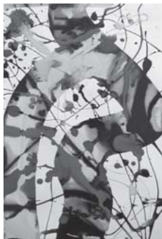
サム・フランシス「無題」 1989 アクリル

サム・フランシス (アクリル画)、ジョン・ケージ (モノタイプ版画)、ソル・ルウィット (版画)、舟越桂 (版画)、山本桂右 (油彩)、深澤幸雄 (版画) 井上隆夫 (立体)、生田丹代子 (ガラス)、大平和正 (立体)、片山雅史 (和紙に墨)、富長敦也 (ドロ잉)、高安醇 (アクリル画)、三樹正典 (軸装アクリル画)、藤田修 (版画)、斉藤祝子 (アクリル画)、石川くるみ (ガラス)