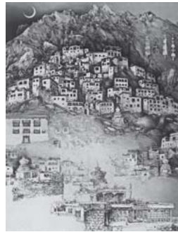
「カルーシャ (カシミール)」

『旅をして、知らなかった事象に出会い、見えるかぎりを見て理解できるかぎりを理解し、それを己が精神の内に取り込み、作品の中で結晶化する。鍵となる言葉は〈世界〉だ。……ヨルクは制作にあたって「精緻な細部の描写」と「夢のように漂うイメージの間を行き来した」と言う。その両極端の間に広がるのが〈世界〉だ。』(池澤夏樹、2011年ギャラリー宮脇個展パンフレットより)