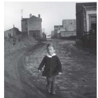
「パビヨンの子供」 1945年

その後も、雑誌『ヴォーグ』や『ライフ』などに写真を提供し、短編映画の製作に携わる傍ら、生涯に渡りパリとそこに生きる人々を撮影し続けました。雑踏の中を自由に歩き廻りとらえた数々の情景は、ドアノーの持つ洗練されたエスプリとユーモアで鮮明に写しだされています。カメラという機械を感じさせない彼の写真は、まるで一瞬のドアノー自身のまばたきのようです。