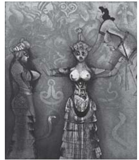
「クノッソス女神 (ギリシャ)」