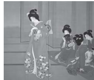
上村松園「舞仕度」 1914(大正3)年

本展は、平成25(2013)年に開催し好評だったPart I に続くPart II として企画された。日本の近現代を代表する日本画家たちの競演が楽しめる。