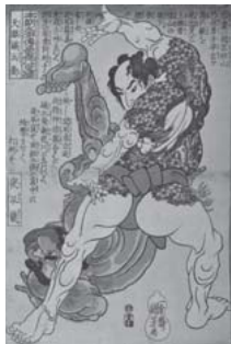
「本朝水滸伝豪傑 八百人一個 天眼礮兵衛 夜叉嵐」 (通期展示)

幕末期に活躍した浮世絵師・歌川国芳(1707-1861)は、江戸期を代表する絵師のなかでも型破りな表現で異才を放っている。画面一杯に巨大な鯨や骸骨が登場するダイナミックな作品、人が集まって顔を形づくる「寄せ絵」や擬人化された猫や金魚の絵など、斬新な発想力とユーモア溢れる作画から、「奇想天外な劇画家」と呼ばれ、近年評価が高まり人気を博している。