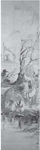
「太公望之図」 1884-85 (明治16-18) 年頃

古書の世界では米僊関連の出版物が多数出廻っているのに、本業の美術世界では無視されてきた。名前は知っているが、実作品を目にした人がどれだけいることだろう。本展では54点の日本画作品と関連資料多数を展観することにより、明治日本画の鬼才・久保田米僊の顕彰再評価への一里塚にしたい。