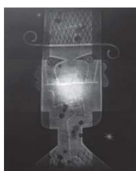
深澤幸雄「小鳥紳士」 1988 銅版