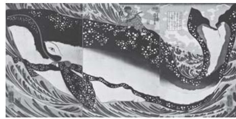
「宮本武蔵と巨鯨」(後期展示)

本展では、武者絵をはじめ戯画、美人画、風景画や現存する数少ない肉筆画など代表作155点を、前・後期で25点の作品入れ替えを含めて展観する。