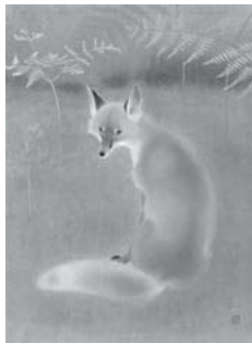
山口華楊「叢原」 1971(昭和昭和46)年 名都美術館蔵

文化勲章は、自然、社会、人文の各科学分野および芸術などの分野にたずさわり、その創造的発展や向上に卓絶した功績のあった者に授与される勲章で、文化に関わる最高位のものでされている。昭和12(1937)年の春に第1回授章式がおこなわれて以降、今日まで日本画で文化勲章を受章した作家は39人に及ぶ。そのうち京都画壇では、竹内栖鳳、上村松園、西山翠嶂、堂本印象、福田平八郎、徳岡神泉、小野竹喬、山口華楊、上村松篁、池田遙邨、秋野不矩の11人が受章した。