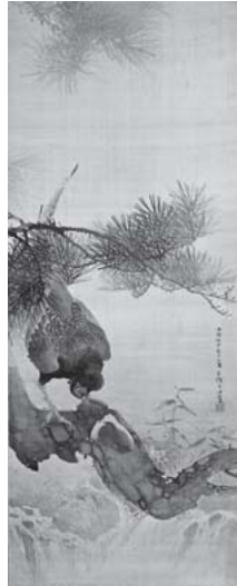
「雉子之図」 1886 (明治19) 年