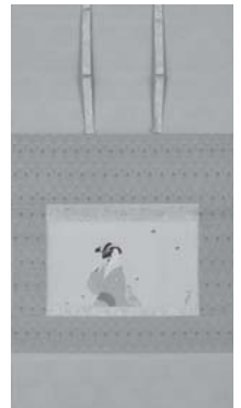
上村松園「紅葉美人」