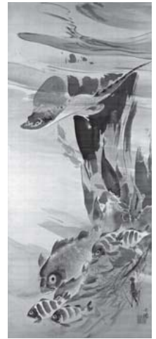
「海魚群遊図」 1883-87 (明治16-20) 年頃