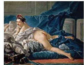
(写真1) フランソワ・プーシェ 「オダリスク」1745年頃

まずフェルメール〈天文学者〉が初来日と話題になっている「ルーヴル美術館展」（京都市美術館）では、16世紀初頭から19世紀半ばまで3世紀半にわたるヨーロッパ風俗画の多彩な展開を、約80点の名画によって紹介。16世紀イタリア・ヴェネツィア派の巨匠ティツィアーノ、16世紀ネーデルランド絵画を代表するピーテル・ブリューゲルをはじめ、ムリーリョ、ヴァトー、プーシェ、シャルダン、フラゴナール、そしてコロヤミレー…。各国、各時代の「顔」ともいべき画家たちの珠玉の名画が集結している。（写真1）