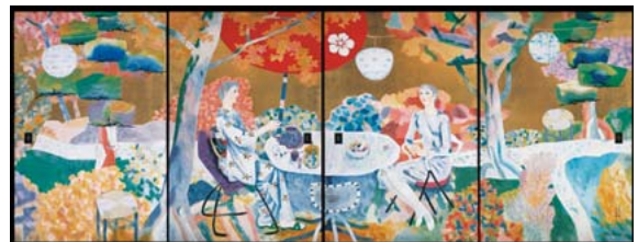
堂本印象「婦女喫茶」1958年(襖絵 智積院蔵)