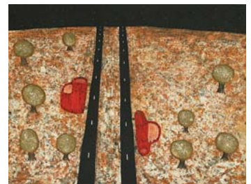
「星降る夜」2005年 67×89cm カラー銅版画