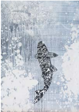
鯉魚登瀛図-アルカディアへ 2015 和紙・墨・雲母粉

❖会期中の11月29日、片山雅史新作品展に合わせ、作曲家池田明子氏との絵画と音楽、異なる二つの分野のアーティストによるコラボレーションが発表されました。今回の共同制作では、片山氏が新たに絵画を制作。