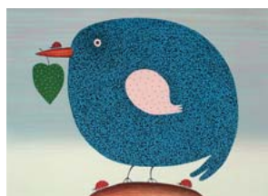
「青い鳥」2015年 48×68cm カラーリトグラフ