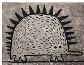
「ヤングハリモグラ」2008年 15×20cm 銅版画