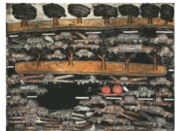
「アーバノロジー 2」1995年 67×89cm カラー銅版画