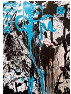
「歓喜」 100×72cm 2015年