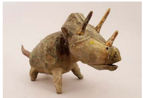
「トリケラトプス」木彫・彩色 10.5×28.5×17.5cm h