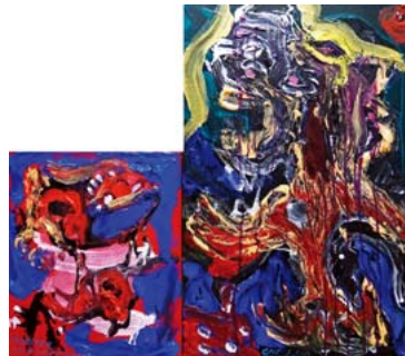
「Check for Monsters」 91×106cm 2015年