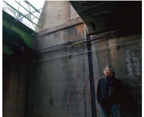
東中野駅近辺のガード下