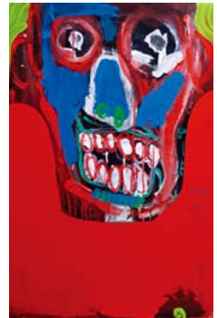
「現代の犠牲者」 100×65cm 2015年

★同時開催：ジェラルド・サンドレイ個展「Visages 顔」 (2F展示室にて、40点)