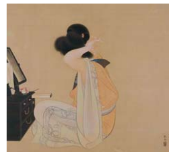
土田麦僊「髪」 1911(明治44)年