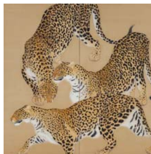
稲垣仲静「猫」 1917(大正6)年