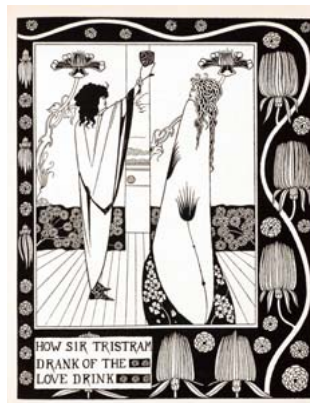
いかにトリストラム卿は愛の媚薬を飲んだか サー・トマス・マロリー著『アーサー王の死』第1巻より

本展は19世紀末から20世紀にかけて、ビアズリーを軸に展開した日英のアートの相愛関係を、およそ270点のイラスト、版画、装幀本で紹介する。わずかに6年に満たない歳月を駆け抜け、常に高い完成度の独創的な仕事を遺した奇才ビアズリー。現代イラストの原点とも言えるその傑作の数々と、妖しい魔力に満ちたビアズリーの白黒の世界から養分を吸い取り、独自の花を咲かせた日英のアーティストたちの個性あふれる作品がお楽しみ。