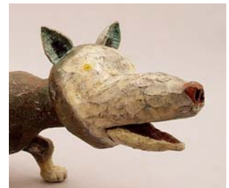
「ジャッカル」木彫・彩色(部分)