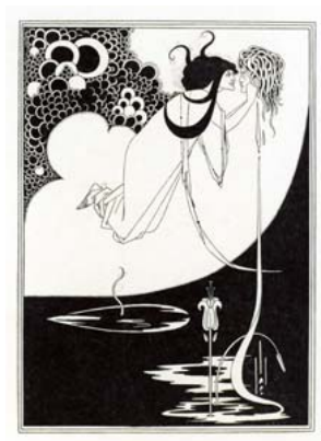
クライマックス 『ビアズリーによるオスカー・ワイルド著「サロメ」の挿画のためのドローイング集』より