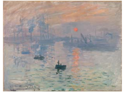
モネ「印象、日の出」(1872年) (3/1～3/21期間限定展示)

印象派を代表する画家クロード・モネ (1840-1926) の没後、多数の作品が息子ミシェルによりマルモッタン美術館に遺贈された。これを機に、同美術館はマルモッタン・モネ美術館と名称を改めた。本展はこのモネ・コレクションを中心に約90点を紹介する。最初期のカリカチュアから妻や子供たちを描いた作品、友人ルノワールによるモネ夫妻の肖像、旅先で描いた風景画、晩年の〈睡蓮〉や〈日本の橋〉などの連作に至るモネの画業を辿る作品群が選ばれている。また特に充実しているのが、生前に公開されることがなかったという晩年の作品で、自身のつくりあげた睡蓮の咲く庭をモチーフとしながらも、それまでの繊細な色調の作品から一転、荒々しい筆致で鮮烈な色の絵の具を塗り重ねたもの。どの作品も白内障を患いながらも絵画への情熱の衰えを感じさせない画家の魂の発露を見せている。また「印象派」の呼び名の由来となった〈印象、日の出〉が京都で33年振りに特別公開 (3月21日まで) される。