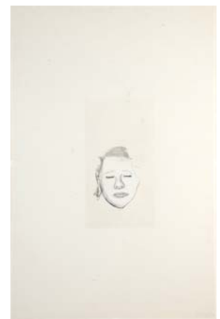
「女の子」2015年制作 105×68cm 紙本、ミクストメディア