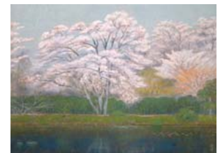
武藤彰「池畔芳春」(龍安寺) 1977(昭和52)年 膠彩/額装