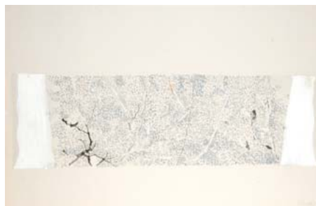
「春」2015年制作 68×105cm 紙本、ミクストメディア