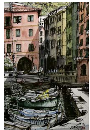
「ヴェルナツァの朝」