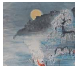
小川千甕「夜桜」 昭和初期頃 絹本彩色/軸装