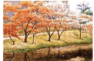
大下藤次郎「勿来」 1907(明治40)年 水彩