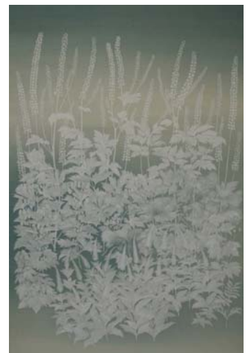
「うたかた」174 × 114cm