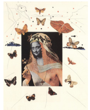
「蝶に囲まれたダリのシュルレアリスムの肖像」1971年

本展は、ダリの初期から円熟期、そして晩年までの200点以上の版画作品を通して、従来の版画そのものの価値観をくつがえした画期的な作風で、20世紀最大の奇才といわれるダリの真髄を検証する展覧会である。