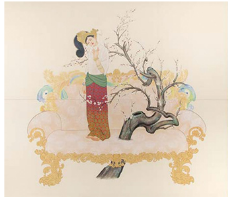
「プライベート・ヒロイン」 パネル連結。絹本着色 2016年 152.0×174.0 cm

甘露な時間をもたらす女性像の表現にさらに磨きをかけた渡邊佳織の世界を、是非ご高覧下さい。