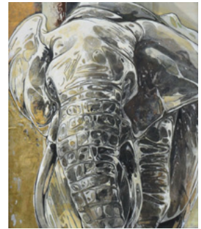
「歪み」 80×68 cm

学生の頃から主に動植物をメインモチーフに日本画材を使って制作して参りました。今回の作品達は過去の作品達よりもより洗練されたものであってほしいと思います。