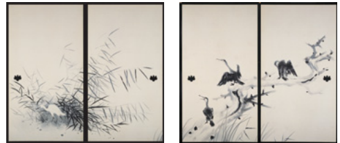
堂本印象「信貴山成福院襖絵」2点

堂本印象 (1891-1975) は、1918年に京都市立絵画専門学校に入学し、その翌年の第1回帝展に初入選して日本画家としての道を歩みはじめた。それ以降、大正、昭和を通しておよそ60年の間に様々な画風を展開し、数多くの作品を制作した。花鳥画、風景画、人物画、仏画から抽象画まで幅広いテーマや表現技法を用いた印象の自在な世界は、日本画壇の中でも独自の境地を築いた。本展では、印象が壮年期に描いた信貴山成福院の襖絵 (非公開) を特別に出品している。その鋭い観察力と冴えた技に注目してほしい。水墨の勢い、淡彩の繊細さなど趣に富んだ筆づかいは、まさに妙技といえる。あわせて40代に描いた作品、下絵も展観することで、妙境に達した印象の世界を紹介している。