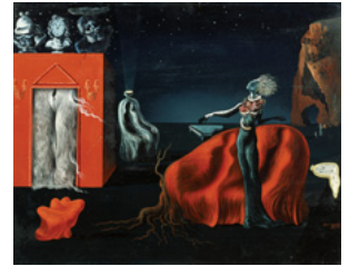
「奇妙なものたち」 1935年頃 (ダリ財団蔵)

本展では、ダリ財団、ダリ美術館、そしてレイナ・ソフィア美術館の3館との共同プロジェクトによって、油彩画のほか、様々なジャンルの作品群が並ぶ。