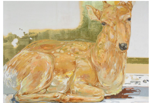
「小麦色に染まる」50号