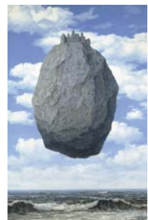
(写真3) ルネ・マグリット 「ピレネーの城」 1959年 (イスラエル博物館蔵)

ユネスコ世界文化遺産登録記念と銘打った、「北大路魯山人・和食の天才」展（京都国立近代美術館）では、「器は料理の着物」として、和食の魅力を豊かに読み解き、その革新に挑んだ魯山人の仕事を通じて、日本の美意識やもてなしの精神、自然観を結晶させた器と料理の関係を紹介している。魯山人の陶芸・絵画・漆芸・書作品などを中心に、料理や献立に関する著述資料、そして京都の料亭の協力により現代の写真家が新しい視点でとらえた写真・映像を織り交ぜた構成で、美を味わう姿勢を貫いた魯山人の世界観を体感できる（毎週金曜は夜間開館：午後8時まで）。(写真2)