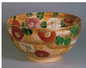
(写真2) 北大路魯山人「色絵金彩椿文鉢」 (京都国立近代美術館蔵)

まずフェルメール〈天文学者〉が初来日と話題になっている「ルーヴル美術館展」（京都市美術館）では、16世紀初頭から19世紀半ばまで3世紀半にわたるヨーロッパ風俗画の多彩な展開を、約80点の名画によって紹介。16世紀イタリア・ヴェネツィア派の巨匠ティツィアーノ、16世紀ネーデルランド絵画を代表するピーテル・ブリューゲルをはじめ、ムリーリョ、ヴァトー、ブーシェ、シャルダン、フラゴナール、そしてコロヤミレー…。各国、各時代の「顔」ともいべき画家たちの珠玉の名画が集結している。(写真1)