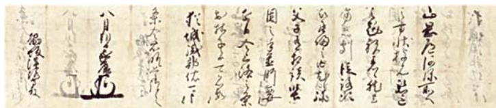
徳川家康書状 慶長5年(1600)八月朔日