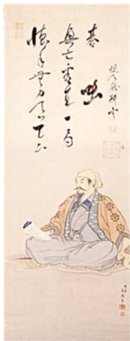
石田三成画像 明治33年(龍潭寺蔵) 岸勝画