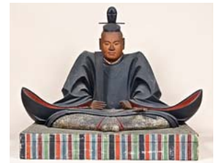
重文 木造徳川家康坐像 江戸時代前期(知恩院蔵)

関ヶ原合戦の直前、京都では伏見城(京都市伏見区)と田辺城(舞鶴市)で後の歴史を左右する重要な戦いがおこなわれた。伏見城攻防戦は関ヶ原合戦の戦端が開かれた戦いで、徳川家康の家臣・鳥居元忠が、わずかの兵で西軍4万の軍勢を相手に10日以上戦い抜いた。また田辺城(舞鶴市)では、歌道の古今伝授を受けた風雅の将・細川幽斎がたった500の兵で西軍と対峙した。最後は時の後陽成天皇が勅許でもって和議をなすという劇的な幕切れで、田辺城は開城した。そのほか、京都近郊の大津城(滋賀県大津市)では、城主の京極高次が石田三成の城明け渡しの勧告を拒否して籠城し、毛利元康や立花宗茂ら勇将を相手に13日間戦い抜き、彼らの関ヶ原着陣を妨げた。大関ヶ原展京都展では、関ヶ原での戦いのほか、伏見城や田辺城、大津城での攻防戦の様子を伝える資料も公開致している。