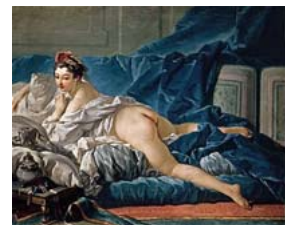
(写真1) フランソワ・ブーシェ 「オダリスク」1745年頃

40年もの長い間、京都画廊連合会ニュースで市内開催の展覧会を紹介してきましたが、この夏ほど素晴らしい企画が同時進行で、同じ岡崎の地を会場に開催されることはあまり覚えがありません。しかもそれぞれの企画が十分に吟味され異なった特色をもつので、美術愛好家にとってはいつどの組み合わせで観に行くのか頭を悩ませることにもなります。7月11日から8月16日の期間は三企画が完全に重なります。予想される人ごみなども考慮されて、どの日に観覧にお出かけになるのかを選んで頂ければ幸いです。