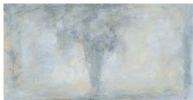
岩倉 壽「桌上的グラス」2014年