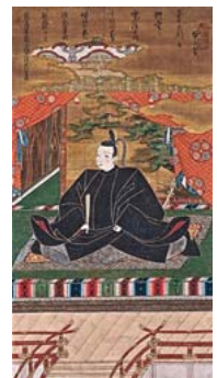
重文 小早川秀秋像 江戸時代前期 (高台寺蔵)