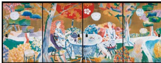
堂本印象「婦女喫茶」1958年(襖絵 智積院蔵)