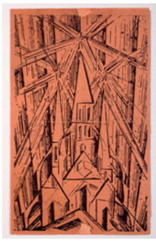
ライオネル・ファイニンガー 「バウハウス宣言」表紙 1919年 (部分) (大阪新美術館蔵)

本展が、「バウハウス宣言」を起点に、理念と実践の連携による教育さらには社会刷新の可能性と重要性、グローバル化とローカリティの関係性、そしてそれを踏まえた文化そしてその交流の多様性について再考する機会になることを期待します。