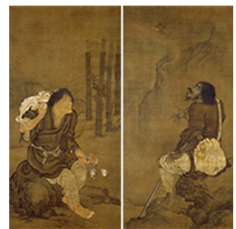
重文 蝦蟇鉄拐図 顔輝筆 京都・知恩寺

知恩寺は、中世から近世にかけて公武ともに厚い信仰を受けてきました。そのため、仏教美術だけではなく、工芸品を含むさまざまな宝物が寄進されました。室町時代の公卿で八代将軍足利義政の正室となった日野富子の兄・日野勝光(1429～1476)や徳川家康(1543～1616)をはじめ歴代の徳川将軍の肖像画もそろっています。また、奇想天外な仙人の姿を描いた「蝦蟇鉄拐図」(重要文化財)は中国・元時代を代表する人物画家の顔輝が描いた、数少ない真筆として世界的に知られています。