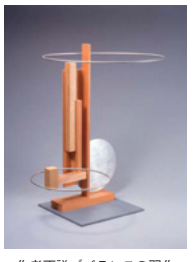
作者不詳 (バランスの習作 (モホイ=ナジの予備課程)) 1924-25