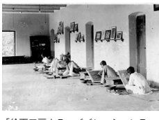
「絵画工房カラ・ババン、シャントイニクタン」 撮影時期不詳