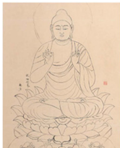
写真左から 下絵 四天王寺宝塔 釈迦如来(部分) 在りし日の四天王寺宝塔堂内 1941年