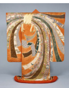
重要文化財 「束熨斗文様振袖」 (友禅史会蔵)

2019年9月、日本で初となるICOM(アイコム)こと国際博物館会議の世界大会が、京都の地で行われることになりました。京都国立博物館ではそれを記念した展覧会を開催します。実は、京博はおおよそ120年前の1897(明治30)年に、京都を中心とする神社仏閣が所蔵する文化財を保護する