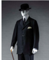
Rogers Peet Company 1900年代 京都服飾文化研究財団所蔵、 島山崇撮影