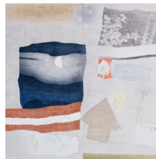
「方丈記考」(感傷的無常) 1985年