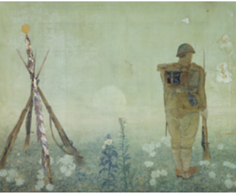
《御旗》(1936年) 京都靈山護国神社(日南町美術館寄託)