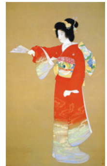
「序の舞」1936年(後期展示)(東京藝術大学蔵)

1974年に同館で開催した「生誕100年記念 上村松園展」から約50年ぶりとなる今回の展覧会では、《序の舞》1936年(東京藝術大学蔵)と《母子》1934年(東京国立近代美術館蔵)の重要文化財に指定された作品2点をはじめ、《焔》1918年(東京国立博物館蔵)、《草紙洗小町》1937年(東京藝術大学蔵)、《砧》1938年(山種美術館蔵)など、全国50か所の国公私立美術館・個人所蔵家の協力を得て、最初期から絶筆に到るまでの代表的な作品100点余りがここ京都に集結する。近代の京都画壇が生んだ不世出の女性画家である上村松園の全貌を一望できるのだが、前期(7/17～8/15)と後期(8/17～9/12)では作品の展示替えがあり、事前に同館のホームページやチラシなどでお目当ての作品の展示期間の確認が必要。