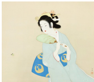
「初夏の夕」1949年(通期展示)