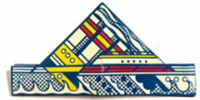
リキテンシュタイン

※7月17日～8月8日 第16回現代アートうちわ展—YouTube動画配信しています。HPをご覧ください。