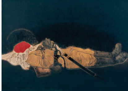
《國之楯》1944年 京都靈山護国神社(日南町美術館寄託)