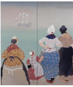
《長崎へ航く》(1931年) (個人蔵)