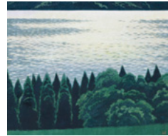
「湖光」1960年代 (ギャラリー鉄斎堂蔵)

しかしその2年後(1948年)には山本丘人、上村松篁、秋野不矩らとともに創造美術(現創画会)を結成して官展を離れ、新しい日本画を創造する活動に身を投じた。それまでの日本画表現に疑義を呈し、自らの制作を厳しく問い直す中で、それまでの繊細な描線から、太い輪郭線や、面として大きく対象を捉えた風景表現を追求。さらに描く対象を大写しにして、大胆に抽象化し、激しい波や雲などの自然現象や木々の生命感を強調する作風も生まれた。