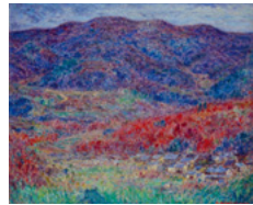
「丹波路」1940 (昭和15)年 油彩12号