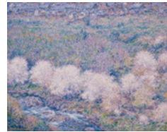
「陽春」1943 (昭和18)年 油彩12号